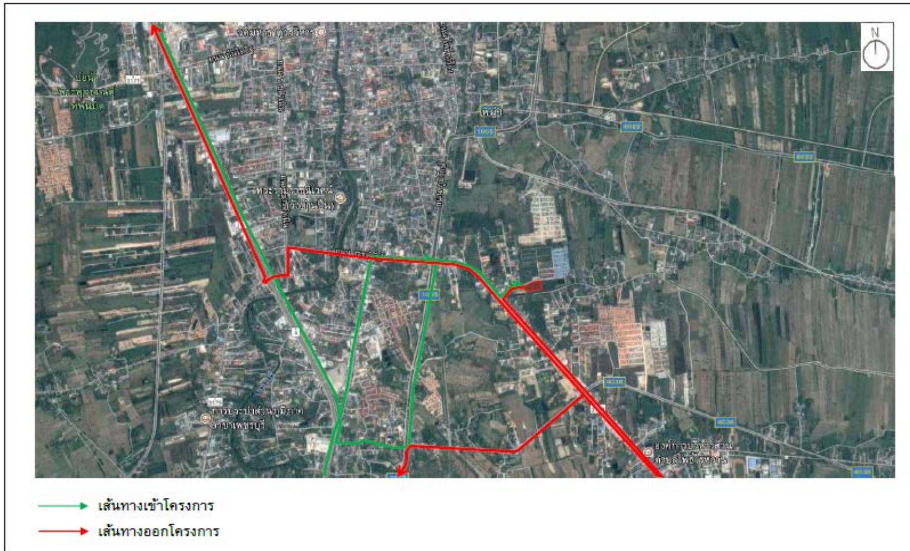
รูปที่ 1-2 แผนที่ตั้งโครงการโดยสังเขป และเส้นทางเดินทางเข้า-ออกพื้นที่โครงการ