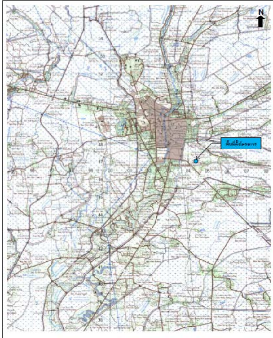
รูปที่ 1-1 ที่ตั้งโครงการ