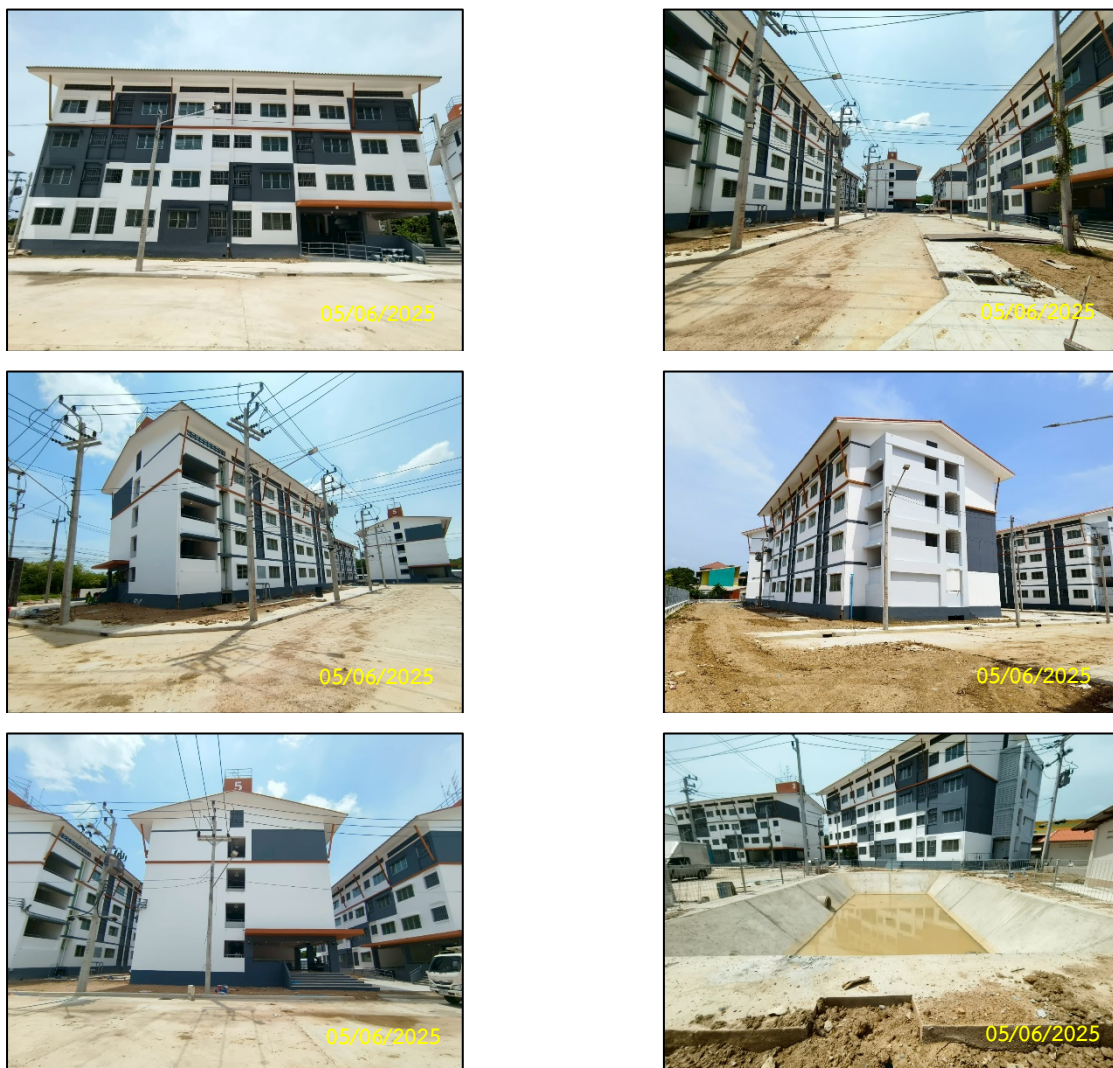
ภาพที่ 1-1 สภาพปัจจุบันของโครงการ

โครงการอาคารเช่าสำหรับผู้มีรายได้น้อย จังหวัดเพชรบุรี (โพไร่หวาน) เป็นโครงการประเภทอาคารอยู่อาศัยรวมแบบให้เช่า ขนาดความสูง 4 ชั้น จำนวน 6 อาคาร (อาคารแบบ A จำนวน 2 อาคาร และอาคารแบบ B จำนวน 4 อาคาร) แต่ละอาคารมีจำนวนห้องพัก 41 ห้อง รวม 6 อาคาร มีจำนวนห้องพัก 246 ห้อง ดังนั้น ทางบริษัทที่ปรึกษาฯ จึงได้ทำการตรวจวัดคุณภาพสิ่งแวดล้อมในระยะตอกเสาเข็มและฐานราก ตามเงื่อนไขของการเคหะแห่งชาติกำหนด ซึ่งในปัจจุบันงานเสาเข็มและฐานราก งานโครงสร้าง และงานก่อสร้างแล้วเสร็จ ทั้ง 6 อาคาร โดยในปัจจุบันเป็นงานภูมิสถาปัตย์ ซึ่งงานแล้วเสร็จโดยรวมทั้งโครงการ ร้อยละ 95 (เดือนมิถุนายน พ.ศ. 2568) แสดงดังภาพที่ 1-1